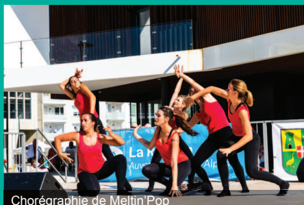
Chorégraphie de Meitini'Pop