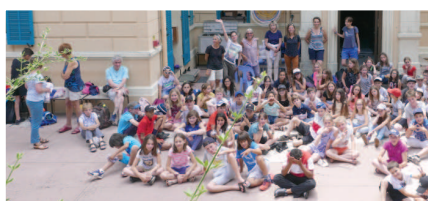
Les élèves de l'Albanne à St Raphaël

Attribution d'une subvention de 7 500 € destinée au financement de classes de découverte ; 3 classes élémentaires de chaque groupe scolaire ont pu découvrir l'environnement marin à St Cyr-sur-Mer pour Concorde et St Raphaël pour l'Albanne du 17 au 22 Juin.