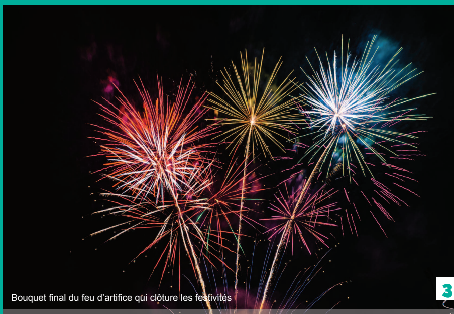
Bouquet final du feu d'artifice qui clôture les festivités