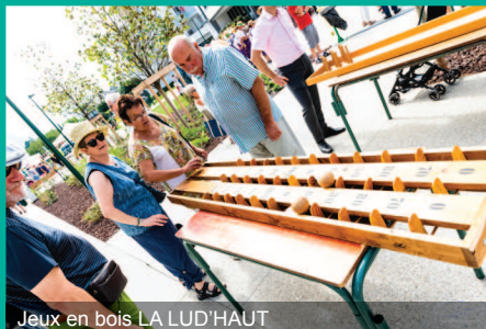
Jeux en bois LA LUD'HAUT