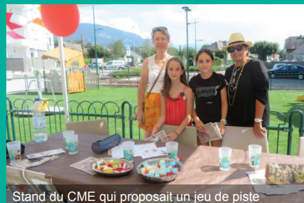
Stand du CME qui proposait un jeu de piste