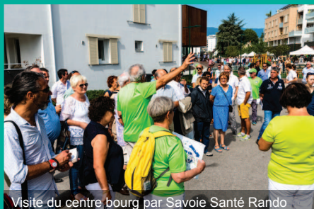
Visite du centre bourg par Savoie Santé Rando