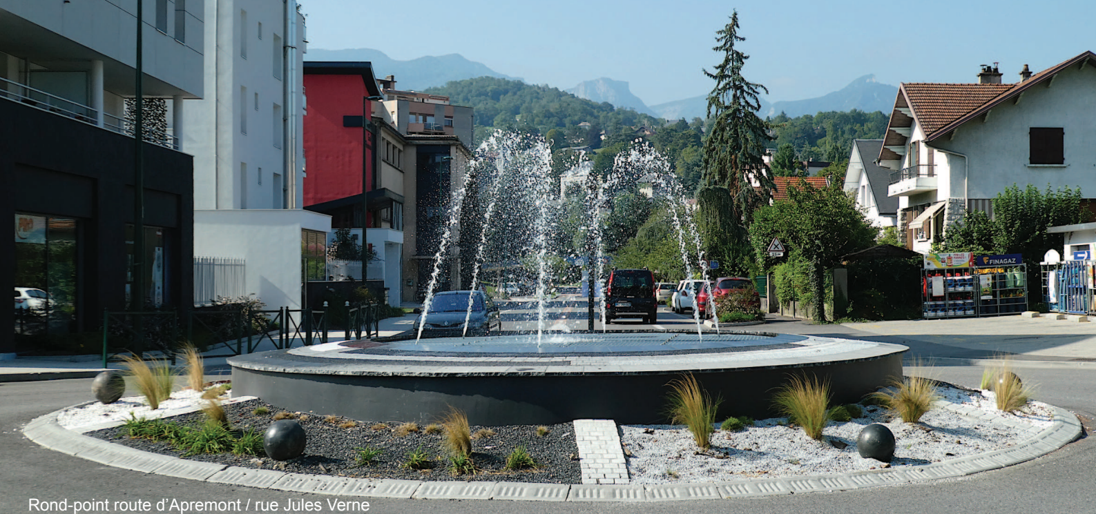
Rond-point route d'Apremont / rue Jules Verne