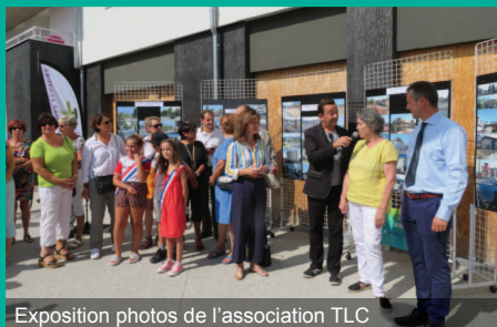
Exposition photos de l'association TLC