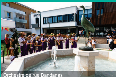
Orchestre de rue Bandanas