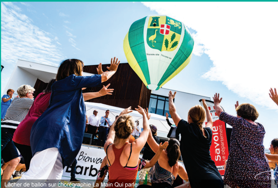
Lâcher de ballon sur chorégraphie La Main Qui parle