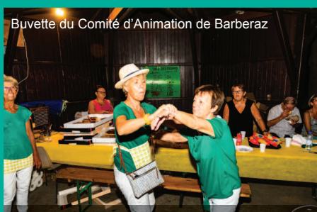
Buvette du Comité d'Animation de Barberaz