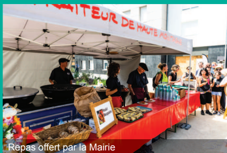
Repas offert par la Mairie